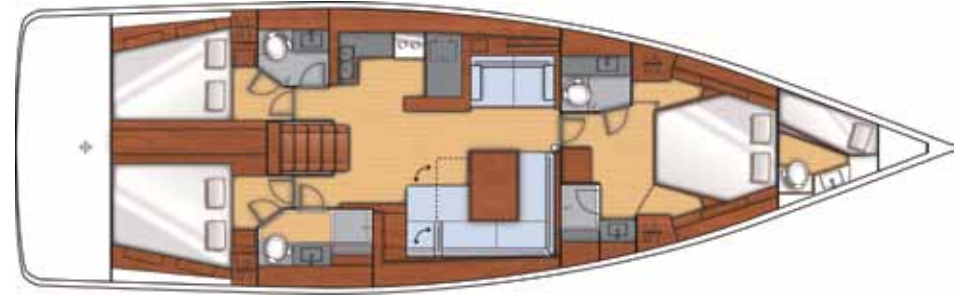
3 Cabins + 3 Toilets