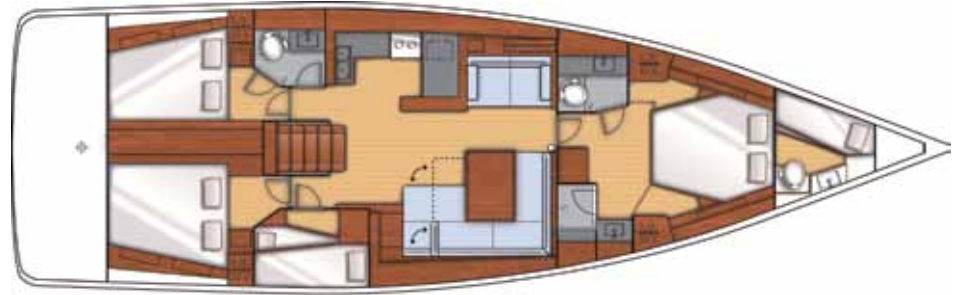
4 Cabins + 2 Toilets